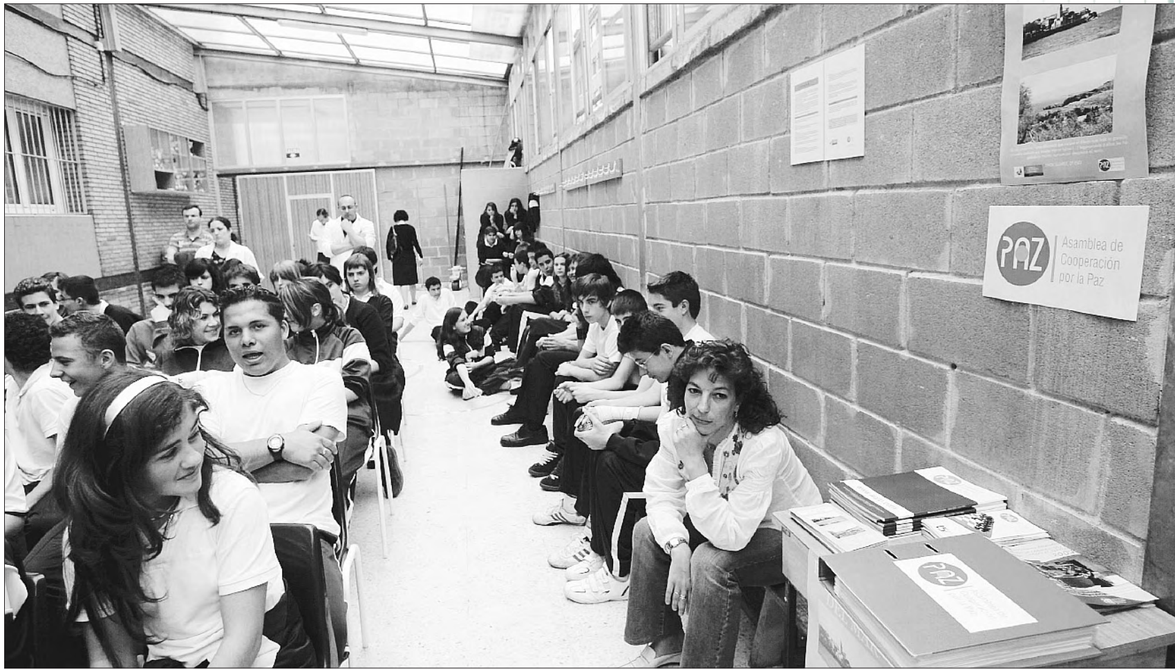
Alumnos del colegio La Milagrosa, de Gijón, con la exposición 'Al otro lado del mar', dentro de Escuelas sin Racismo.

La intervención se realizó en centros públicos y concertados de Oviedo, Avilés, Castrillón, Corvera, Gozón, Salas, Cudillero, Pola de Allande, Degaña, Llanes, Laviana, Noreña, Navia, Mieres, Villayón, La Felguera, Sotroñdo, Piloña, Grandas de Salime, Pravia y finalizó la pasada semana en Gijón. A lo largo de dos horas, cada grupo de alumnos tuvo un acercamiento a los derechos humanos y a la di-