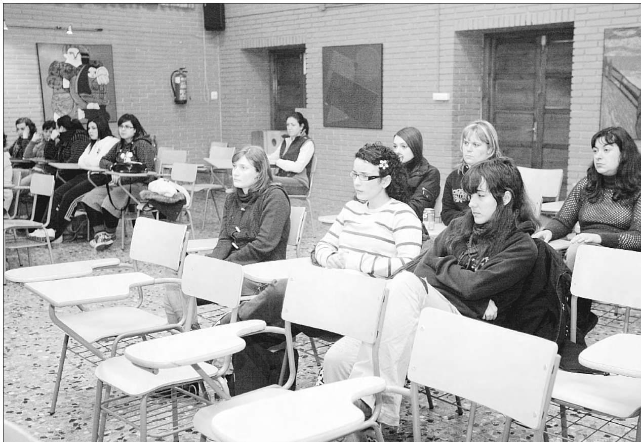
Estudiantes del IES Roces, de Gijón, en el proyecto 'El racismo no es un derecho'.