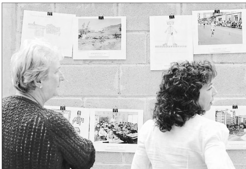
Exposición de dibujos y fotos de La Milagrosa.

tituto desarrolla o adapta a sus necesidades.