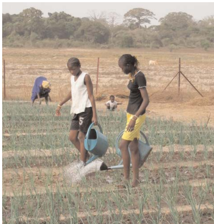
Mujeres senegalesas riegan un huerto creado por ACPD.

tos para garantizar que los beneficiarios dispongan de alimentos suficientes en cantidad y calidad, ACPD tiene ante sí el reto de sistematizar el trabajo que venimos realizando, invitar a nuestras contrapartes a integrarse en redes de lucha contra el hambre y denunciar en todas las instancias sus causas estructurales.