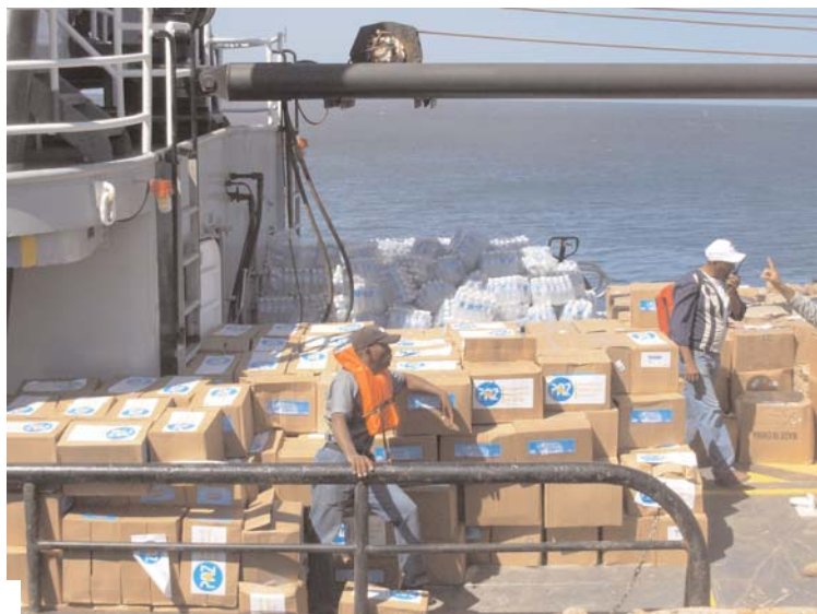
Imagen de la carga de ayuda humanitaria de un barco de la Marina dominicana. Abajo, descarga de un barco en Jacmel.

Aunque desconocemos lo que los medios cuentan de lo que está pasando aquí, la realidad de Jacmel es muy apacible. Estamos radicalmente lejos de disturbios y violencia. No podríamos anotar ni tan siquiera una situación de tensión. Y la gente se está comportando de una manera increíble. A pesar de los sufrimientos, de haber perdido casas y familia-