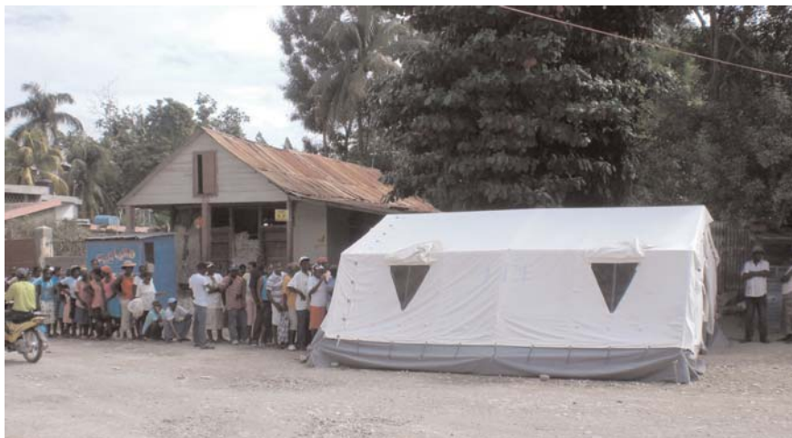
Sobre estas líneas, personas esperando a ser atendidas en un puesto de salud creado por CROSE y ACPPE en un campamento de Jacmel. Abajo, imagen de los daños del terremoto.

En la emergencia estamos trabajando con la ONG española Solidaridad Internacional (SI). Juntos colaboramos con CROSE, y CROSE a su vez con otras contrapartes europeas. Semanalmente nos reunimos todos para determinar necesidades y qué actuaciones hay que hacer o seguir haciendo. Por nuestra parte, ACPPE y SI - Haití estamos trabajando con ACPPE-República Dominicana de manera muy compenetrada, estamos en contacto constante. Nosotros hacemos las identificaciones vía CROSE y las transmitimos a nuestros compañeros de Dominicana. Ellos lo compran todo allí, hacen el transporte en camiones hasta Pedernales, y de Pedernales, en barcos -cortesía de la Marina de Guerra Dominicana- la carga llega marcada con los logos de ACPPE o SI, y la recibimos en el puerto de