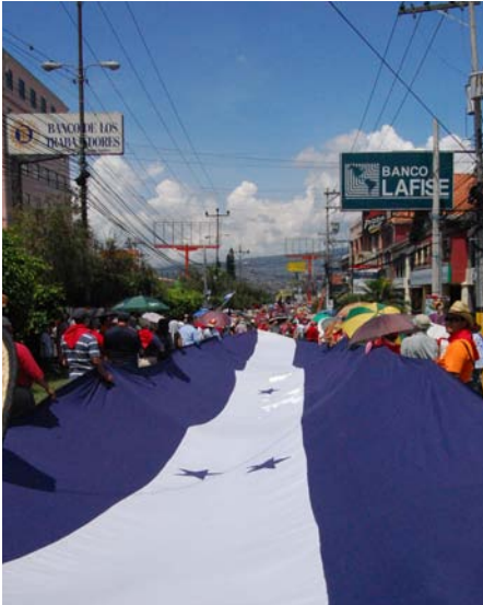
Manifestación en Honduras.

maestros y maestras de la Universidad Pedagógica Nacional, los actos intimidatorios contra campesinos y las agresiones a periodistas, sin que en ningún momento se aclaren los hechos.