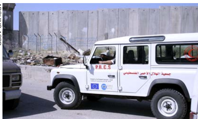
Ambulancia con el Creciente Rojo en Palestina.