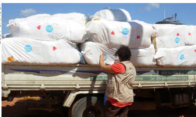
Descarga de ayuda humanitaria en Haití.