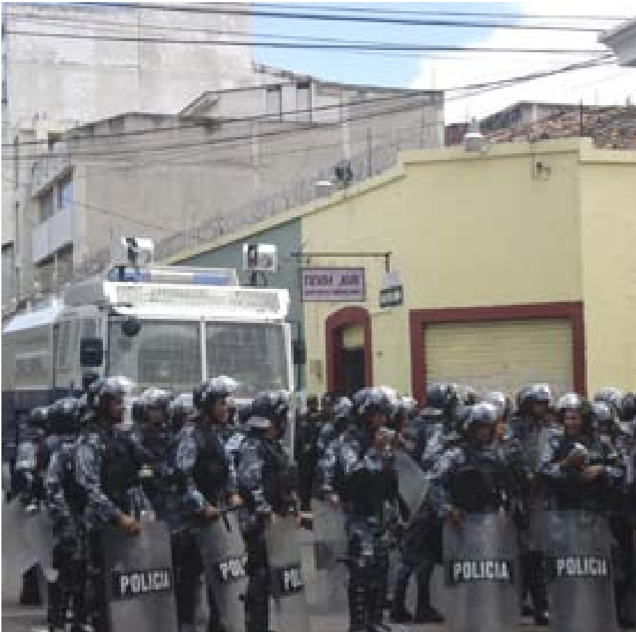
Policía antidisturbios a la espera en una manifestación.