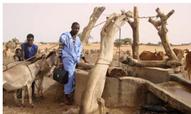
Pozo en Mauritania.

En Mauritania , ACPP y la Fundación CEAR-Habitáfrica y sus contrapartes en el país pretenden contribuir a la lucha contra el analfabetismo mediante la construcción, rehabilitación y equipamiento de escuelas, mediante la formación de docentes y de la población para promover la escolarización de las niñas, garantizar el buen uso de las infraestructuras creadas y cuidar el medio ambiente, así como el refuerzo de las asociaciones de padres y madres.