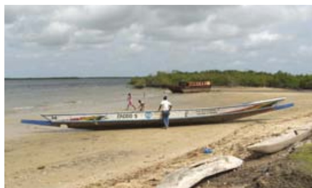
Piragua de ACPP en Senegal.