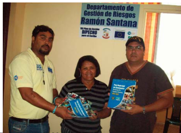
Equipo de la Unidad de Gestión de Riesgos.

Siguiendo el criterio de que las acciones a desarrollar debían realizarse en comunidades en las que el IDAC y ACPP tuviera una presencia consolidada, y en vista de la situación de extrema pobreza de las comunidades estudiadas, ACPP e IDAC apostaron por la preparación comunitaria ante desastres para la reducción de la vulnerabilidad de las comunidades situadas en la ribera del Río Zoco, en los Municipios de Ramón Santana y San Pedro de Macorís, con una duración de quince meses. El objetivo era reducir la vulnerabilidad de la población de República Dominicana frente a los desastres.