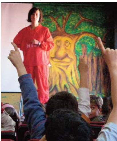
Representación de Teatro-Fórum.