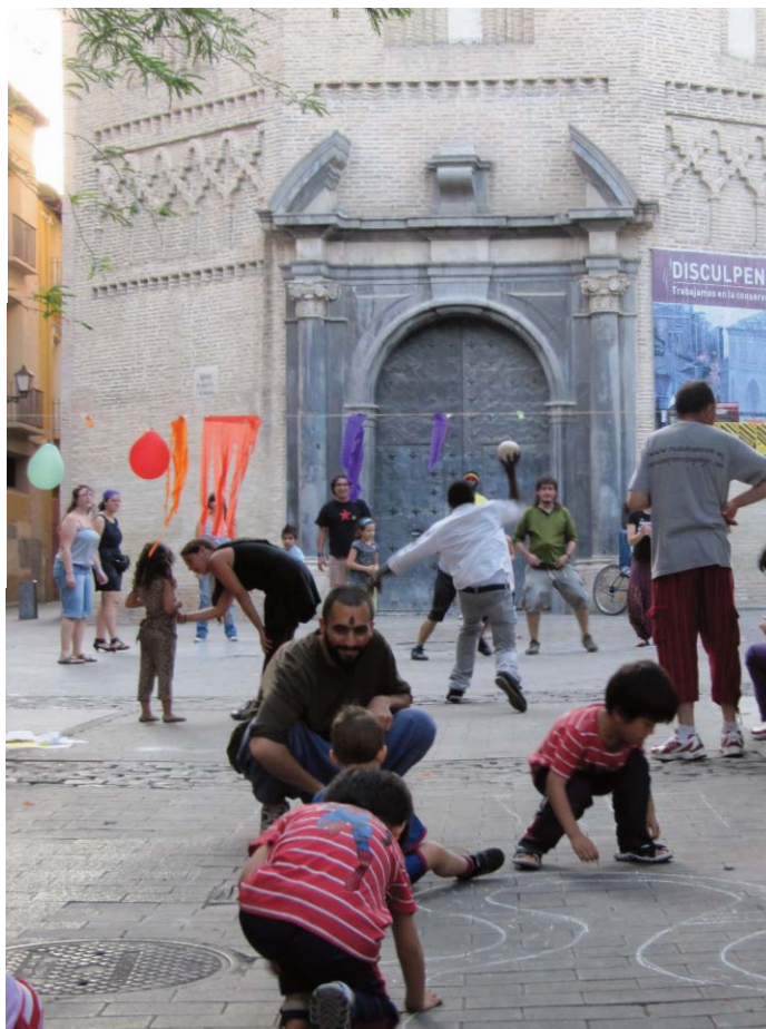
Momento de la jornada abierta.