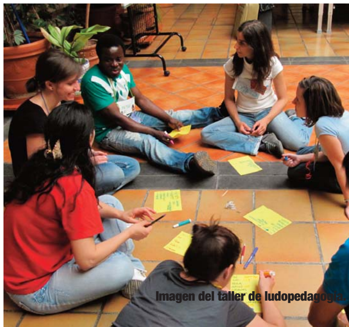
Imagen del taller de ludopedagogía.