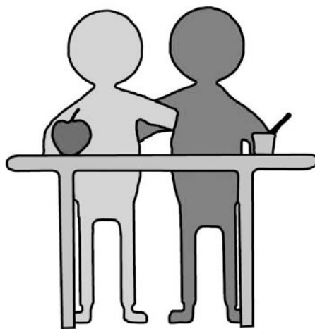
El logo del programa.

nerse en la piel del otro, valorar la diversidad como riqueza..., partiendo de conocer la propia identidad y cultura, recuperar la memoria histórica -nosotros también fuimos emigrantes-, analizar y rechazar estereotipos falsos y fomentar un ambiente intercultural en el centro.