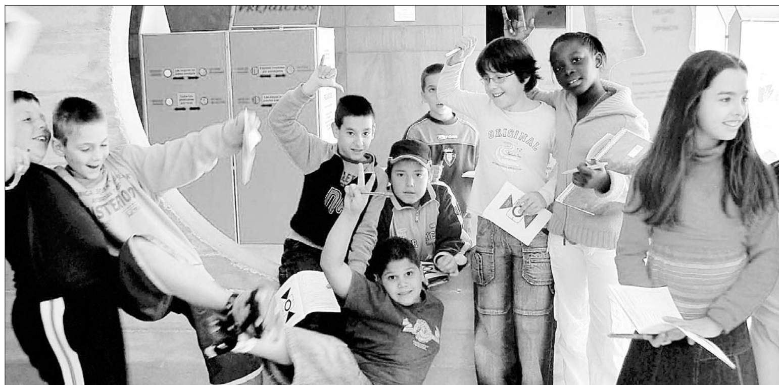
Alumnos del colegio público Ermitaberri de Burlada, tras realizar una de las actividades del programa de Escuelas Sin Racismo, por la Paz y el Desarrollo.