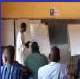
Formación en Kita