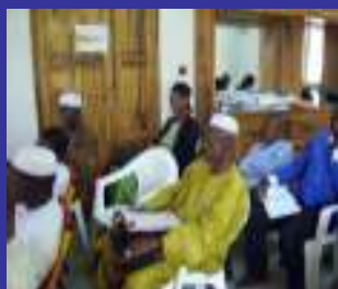
Formación en Bamako