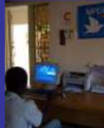
Informática en Bamako