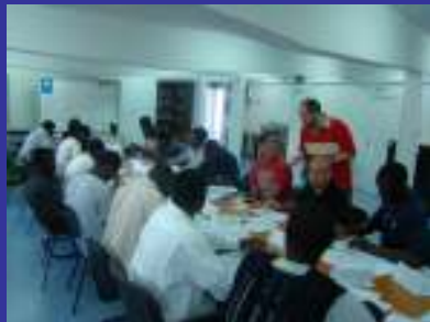
Formación en castellano