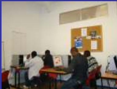
Formación en informática