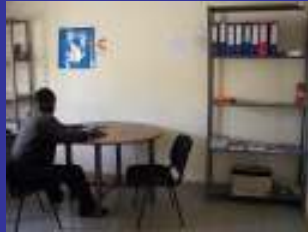
Local de Bamako