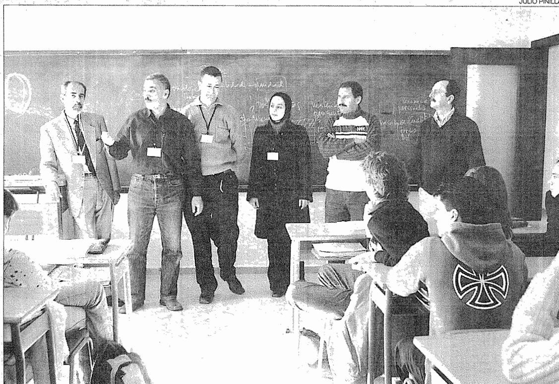
Profesores de Marruecos, en su visita a Asturias.

Bajo el título 'Jornadas de Educación al Desarrollo, Interculturalidad y Sensibilización Social. Intercambio Asturias-Marruecos' los docentes entraron en contacto con el sistema educativo asturiano e intercambiaron experiencias con los estudiantes. Entre los centros visitados se encuentra el colegio La Milagrosa, de Gijón, que el pasado año participó en la experiencia 'El otro lado del mar', un proyecto educativo y de sensibilización que pretendía dar a conocer la realidad de dos culturas distintas. Los escolares de Gijón y los del colegio de la Comuna de Torres en Al-